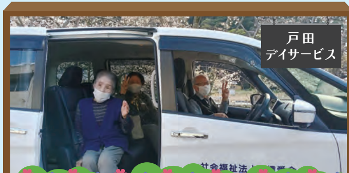
戸田 デイサービス