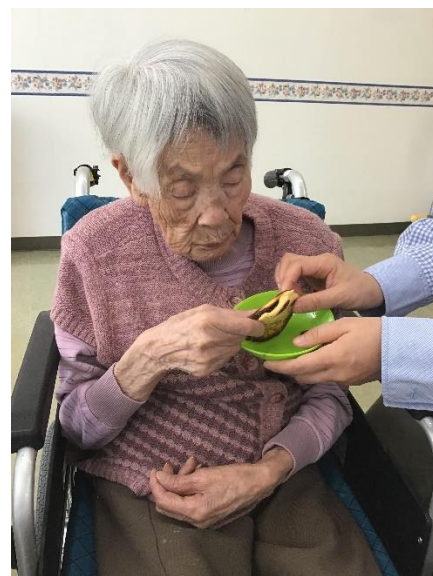
「どれどれ味見を・・・」