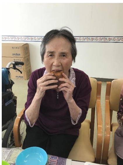
「美味しく頂きます～！！」