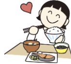
減塩・減糖・減脂でおいしく