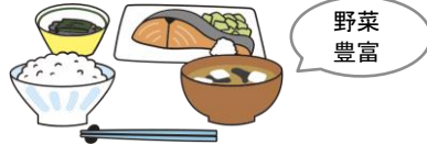
主食・主菜・副菜をそろえる

園では、子どもに必要な栄養を満たした食事を、食育の一部として計画的に提供しています。食経験の少ない子どもが無理なく、楽しく食べることができ、必要な栄養も摂取できるように、食材と調理法を選択しながら主食・主菜・副菜をそろえています。特に健康に欠かすことができないビタミン、ミネラル、食物繊維を多く含む「野菜」を積極的に取り入れています。また、将来の生活習慣病に配慮し、「減塩」「減糖」「減脂」を心がけ、健康的な食事で、しっかり栄養を摂取することを目指しています。