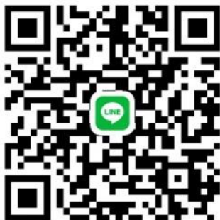
【 土肥ホーム面会用 LINE QRコード 】