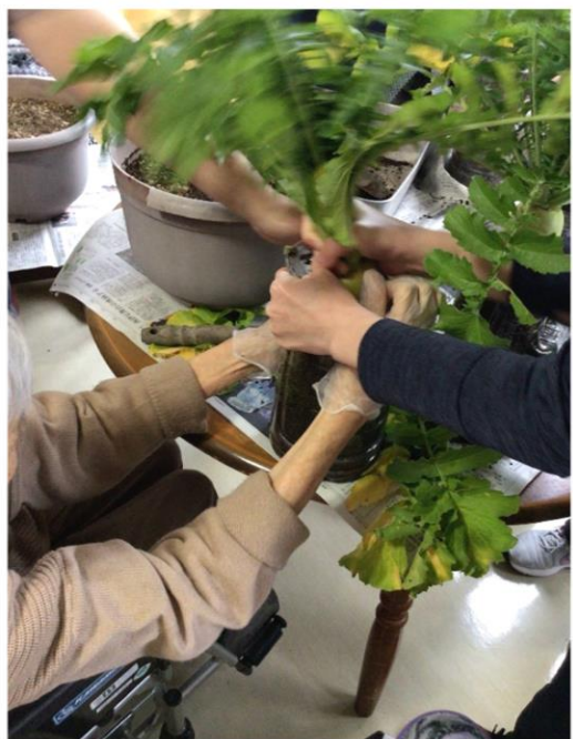
3人がかりで収穫しました