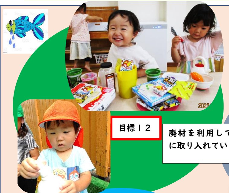
目標 12 廃材を利用して、遊びに取り入れています。