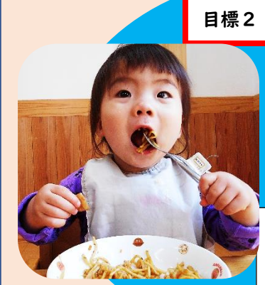
目標 2 楽しい食事 自分で食べられる 幸せ