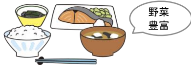
主食・主菜・副菜をそろえる

園では、子どもに必要な栄養を満たした食事を、食育の一部として計画的に提供しています。食経験の少ない子どもが無理なく、楽しく食べることができ、必要な栄養も摂取できるように、食材と調理法を選択しながら主食・主菜・副菜をそろえています。特に健康に欠かすことができないビタミン、ミネラル、食物繊維を多く含む「野菜」を積極的に取り入れています。また、将来の生活習慣病に配慮し、「減塩」「減糖」「減脂」を心がけ、健康的な食事で、しっかり栄養を摂取することを目指しています。