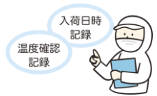
安全な食材の購入

低年齢児は、身体が小さく、抵抗力が弱いため、少量の菌で食中毒の症状を呈するリスクがあります。給食では「安全」のために、厳格なルールのもとで管理された食事を提供しています。 食中毒の予防3原則は、「つけない」「ふやさない」「やっつける」 。家庭でも衛生的な食事の提供を心がけましょう。