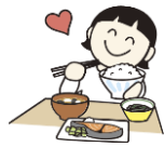
減塩・減糖・減脂でおいしく