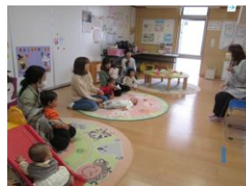
読み聞かせ ペープサート