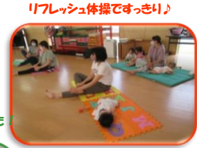
リフレッシュ体操ですっきり♪