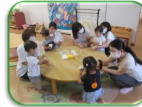
集いのご参加、ありがとうございました